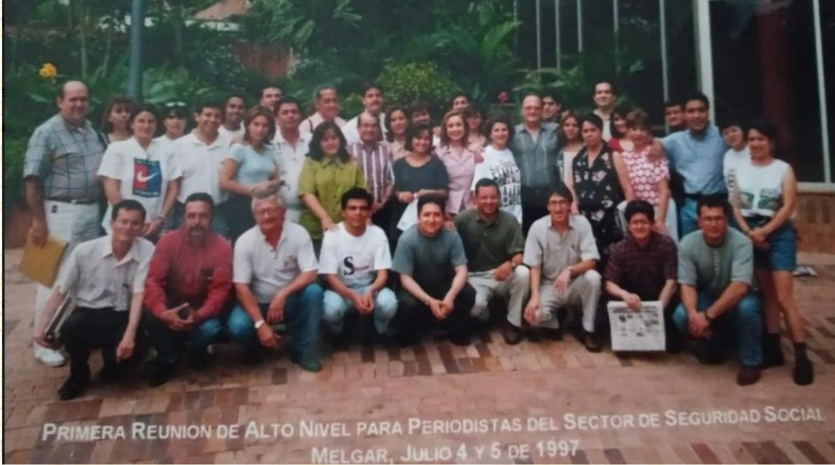
PRIMERA REUNIÓN DE ALTO NIVEL PARA PERIODISTAS DEL SECTOR DE SEGURIDAD SOCIAL MELGAR, JULIO 4 Y 5 DE 1997